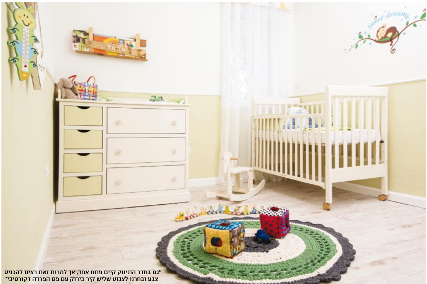
"גם בחדר התינוק קיים פתח אחד, אך למרות זאת רצינו להכניס צבע ובחרנו לצבוע שליש קיר בירוק עם פס הפרדה דקורטיבי"