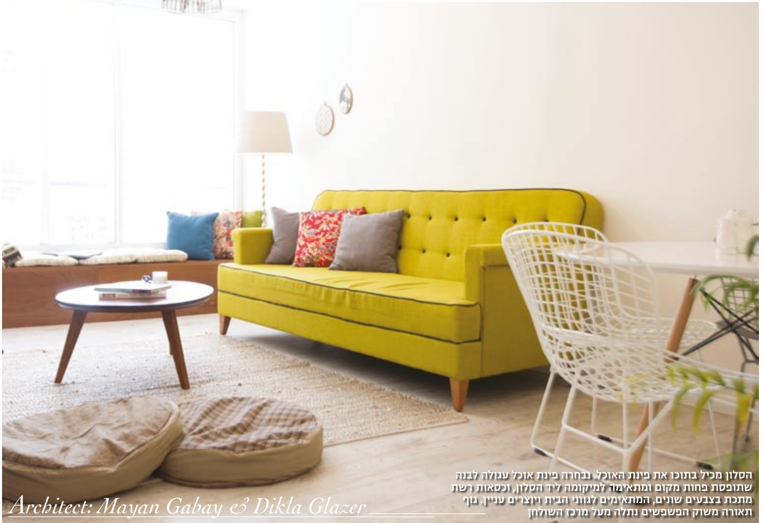
הסלון מכיל בתוכו את פינת האוכל. נבחרה פינת אוכל עגולה לבנה שתופסת פחות מקום ומתאימה למיקומה ליד הסלון, וכסאות רשת מתכת בצבעים שונים, המתאימים לגווי הבית ויוצרים עניין. גוף תאורה משוק הפשפשים נתלה מעל מרכז השולחן